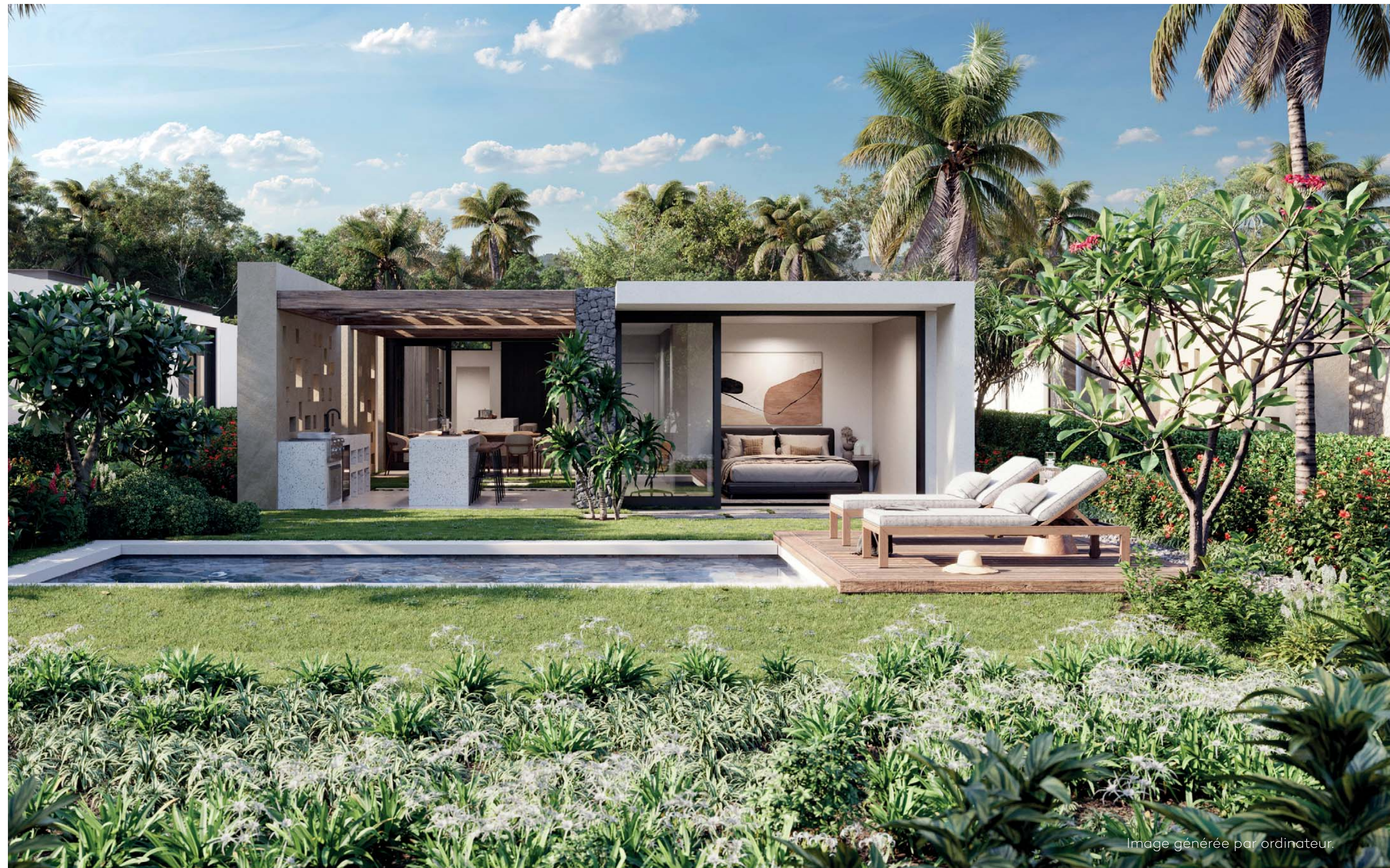
Image générée par ordinateur.

Les espaces de vie s'entremêlent aisément sans obstruction, optimisant ainsi le paysage extérieur.