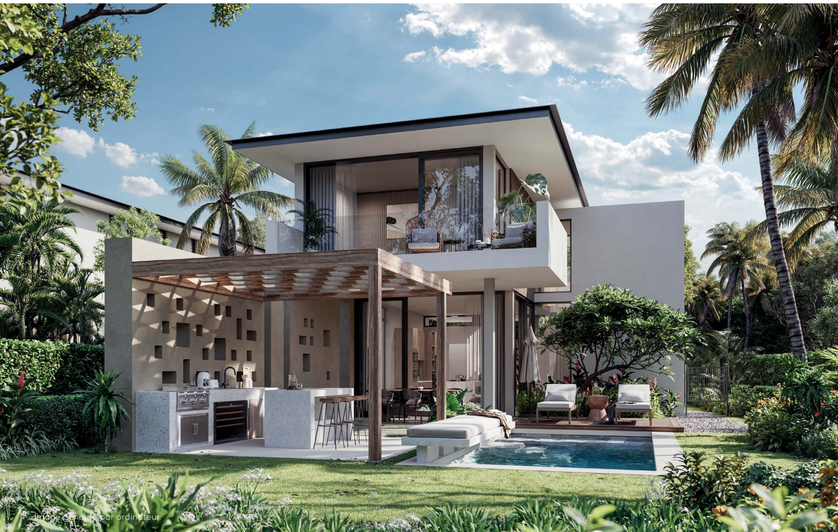
Image générée par ordinateur.