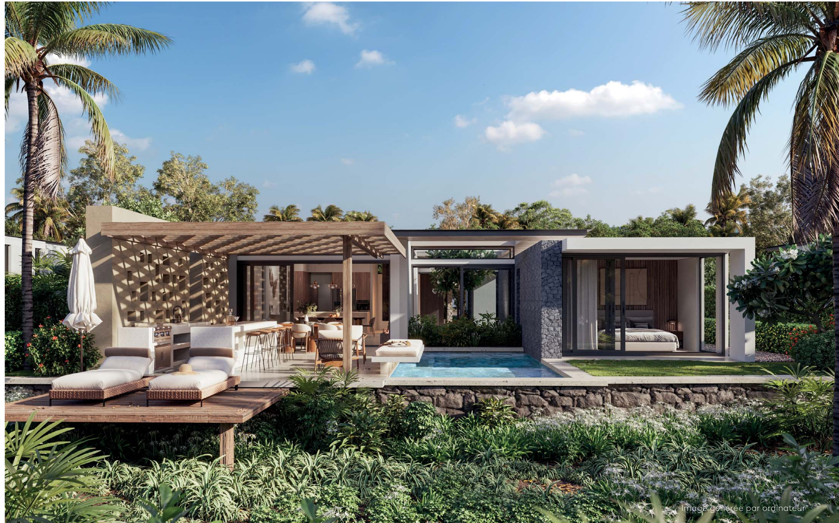
Image générée par ordinateur

Ouvrez les yeux sur de nouveaux horizons.