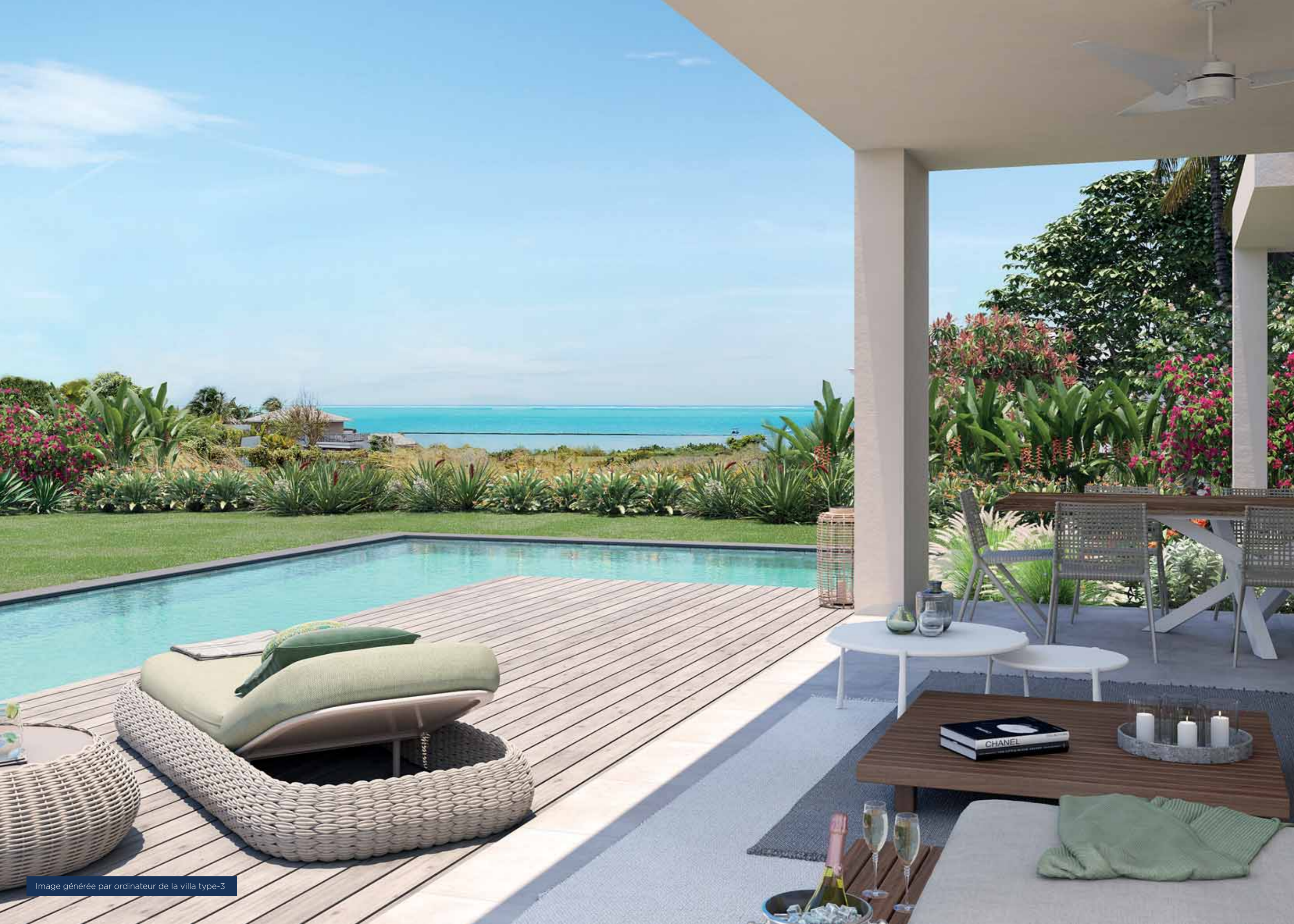
Image générée par ordinateur de la villa type-3